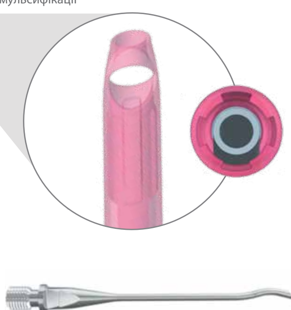
Збалансовані фако-голки INTREPID® Balanced Tip та іригаційні рукава INTREPID® призначені для зниження теплового профілю.