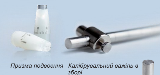
Призма подвоєння Калібрувальний важіль в зборі