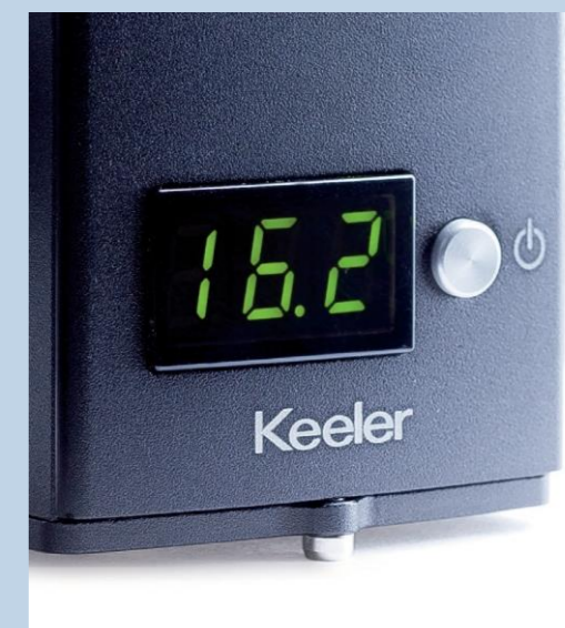
Прозорий світлодіодний дисплей