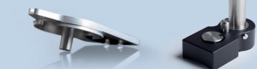
Направляюча панель T-Туре